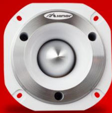
HST 600 WHITE