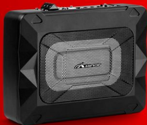
ACTIVE BOX ALUMINIUM 5X8"