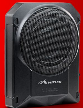
ACTIVE BOX ALUMINIUM 10"