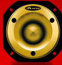
HST 600 GOLD