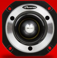
HST 600 BLACK