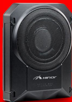
ACTIVE BOX ALUMINIUM 8"